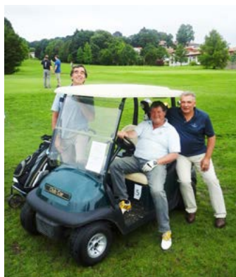
Il n'y a pas que des vaillants au golf!

-Une compétition de golf formule de jeux : « Stroke Play Stableford » ( je vous laisse traduire....) en équipe de 3 ou 4 et des départs à partir de 14 heures toutes les 10 minutes, le tout en 18 trous.