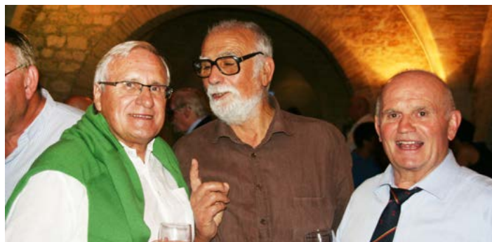
Quand les psychiatres se rencontrent