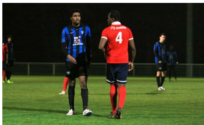
Duel de costauds dans l'axe.

Mais quel plaisir de voir ces petits gars jouer comme ça. Après le quart de finale de la coupe d'Aquitaine et la demi-finale de la Coupe de Bordeaux, sacrés parcours, le BEC a désormais la montée en PH qui lui tend les bras. Il ne faudra pas se rater dimanche face à Cadaujac.