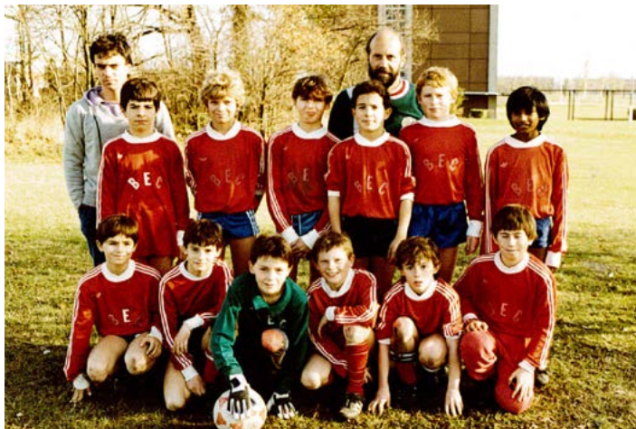
AVEC LES PETITS

Outre les classiques sorties piscine, skate parc ou cinéma, si temps douteux... une a été réalisée à Walibi et deux vers le lac d'Hostens et ses activités nautiques, en commun petits et ados