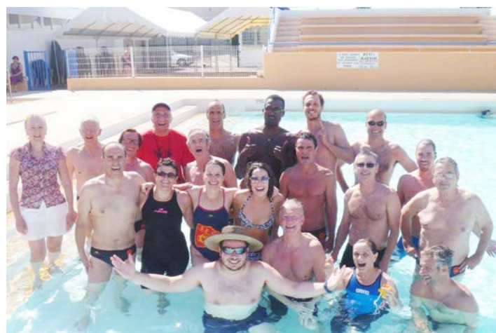
Natation - Langon

La section compte également dans ses rangs un certain nombre d'officiels fédéraux diplômés (20) tous bénévoles, qui font partie des jurys lors des compétitions tout au long de la saison. Les clubs sont tenus de présenter un quota d'officiels à chaque compétition en fonction de l'effectif de nageurs engagés, le défaut de cette règle entraînant une sanction financière non négligeable.