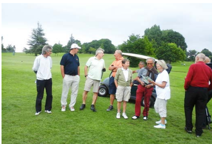
Discussion d'avant départ du parcours de golf