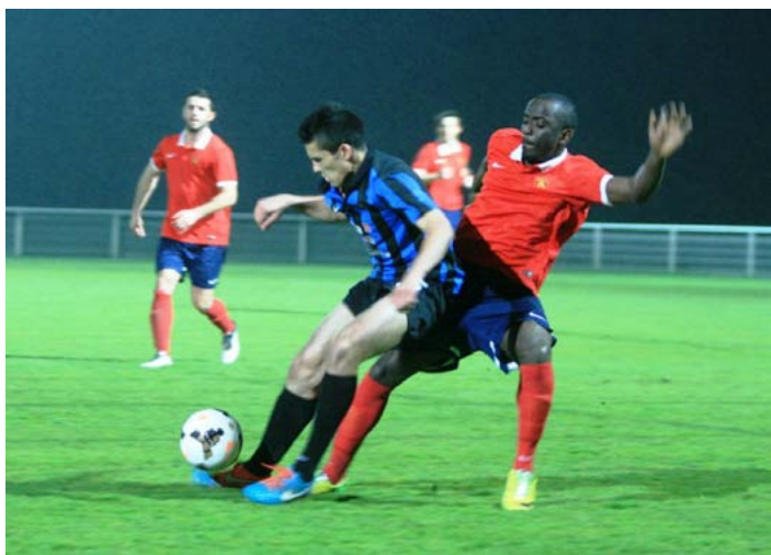
Les attaquants et Astia face à un mur.