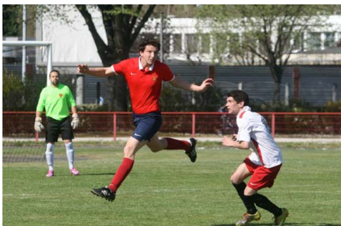
L'envol de capi.