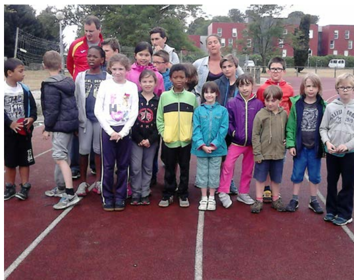
Les ados du CLSH