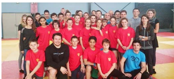
Natation - stage creps

La saison qui vient de se terminer le 15 août dernier, à l'issue des championnats du monde masters à Kazan, a encore été très dense en terme d'activités et de participation à des événements sportifs. L'école de Natation tout d'abord qui regroupe 250 enfants en apprentissage, perfectionnement et pré-compétition a encore représenté une part importante de notre activité .