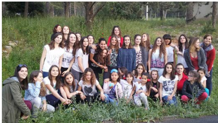
Déplacement en mai 2015 à Montpellier pour les championnats de zone critérium

C'est finalement à 12 que les filles sont parties pour le championnat de zone organisé par le club de Toulouse en décembre 2014 pour décrocher le podium ou la place qui leur permettra d'accéder à la finale organisée par Pfstatt en Janvier 2015.