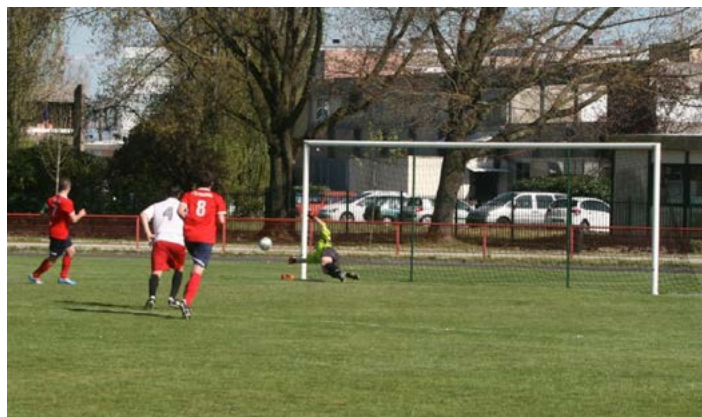
Le bel arrêt du gardien de Cadaujac.