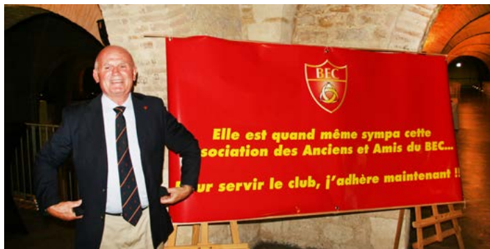
Le Président présentant le message fort de notre association

Refaire une telle manifestation était osée la période de quatre années étant à la fois longue et courte, la répétition d'un tel évènement présentant un risque.