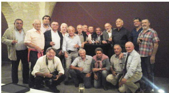
L'équipe des années 70