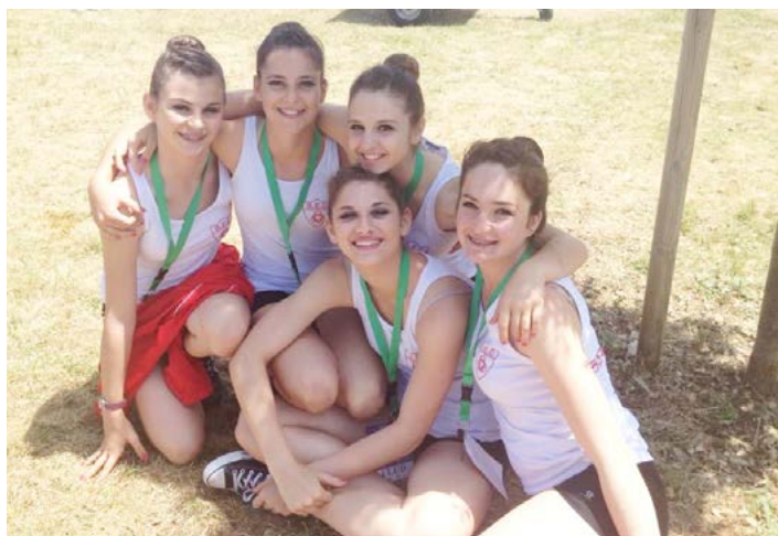
Nos cadettes, 14ème au championnat de France à Niort en juin 2015