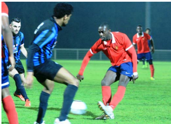
Grosse bataille au milieu.