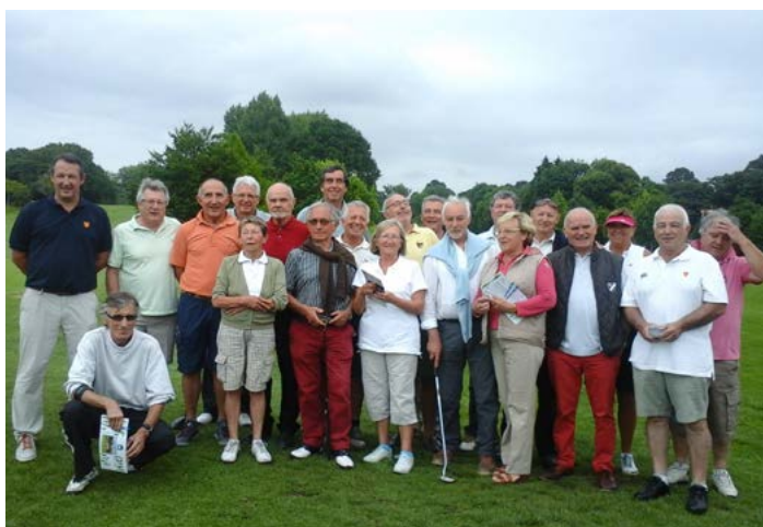
Nos golfeurs avant le départ