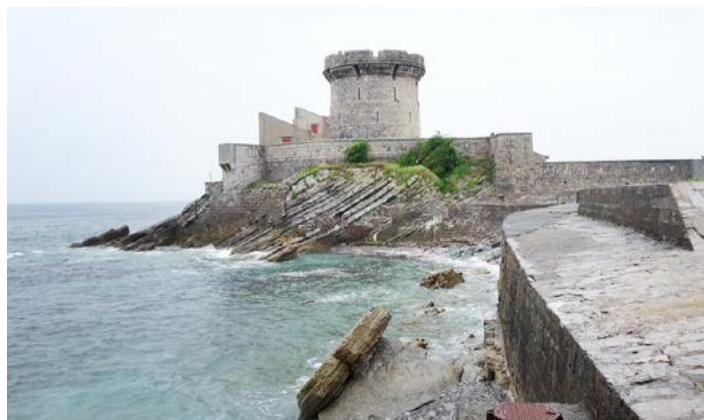
Vue de la mer du fort de Socoa

Nous dévalons, objets flottants vers Socoa et ses digues élevées après les destructions catastrophiques de quartiers entiers dont les témoins sont enfouis sous le sable de la grande plage