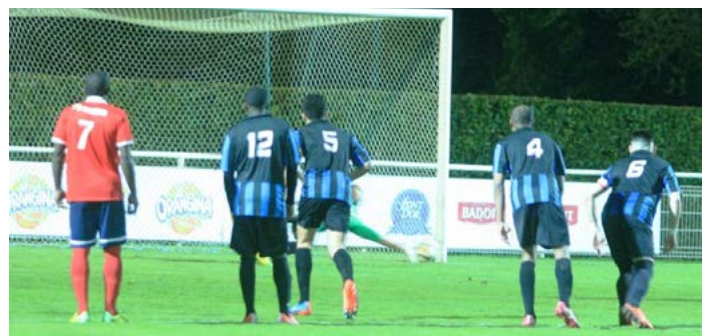
Le gardien se détend très bien pour sortir le péno.