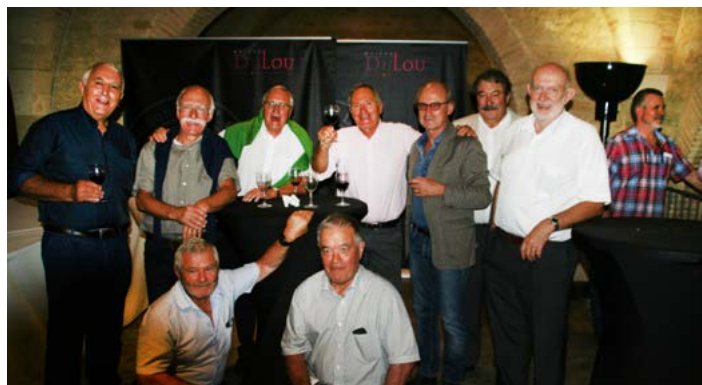
L'équipe juniors de 1968