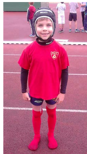
un jeune rugbyman motivé