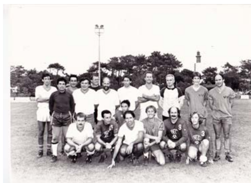
tournoi ferret 1989