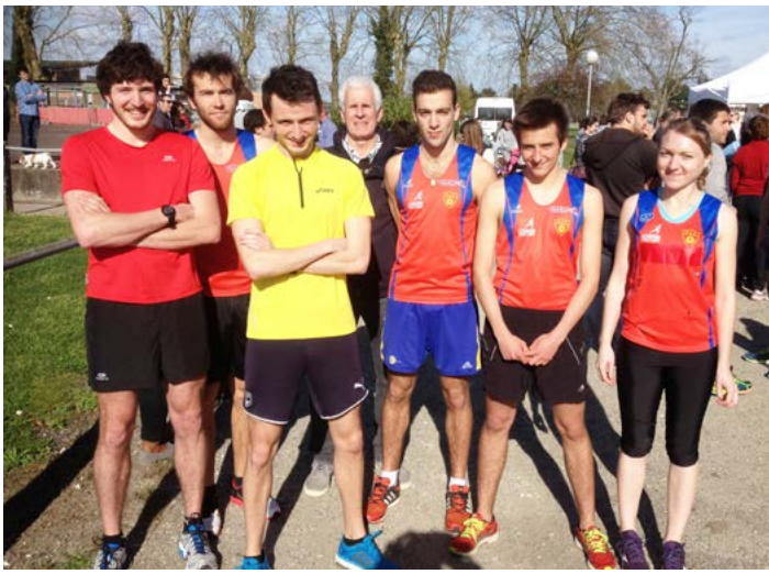
Equipe du BEC de demi fond course CROUS Avril 2015