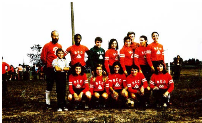
Les féminines du BEC