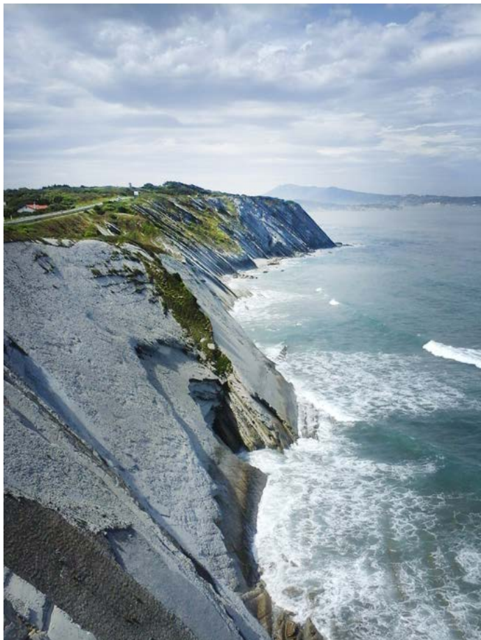
Les falaises de la côte d'Hendaye