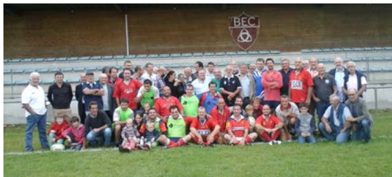
Photo de famille après le après match