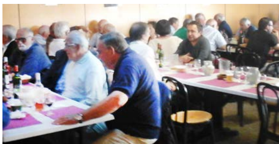
Le déjeuner du dimanche