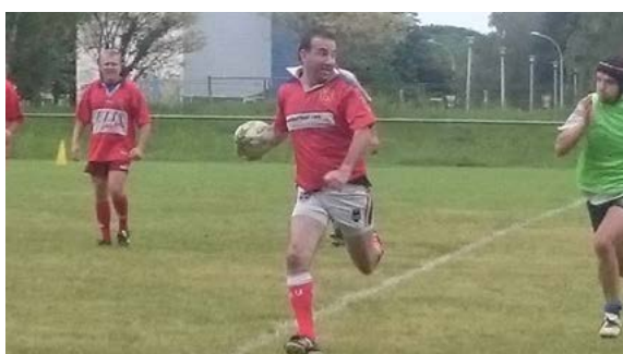
T. St Pic arrive encore à accélérer