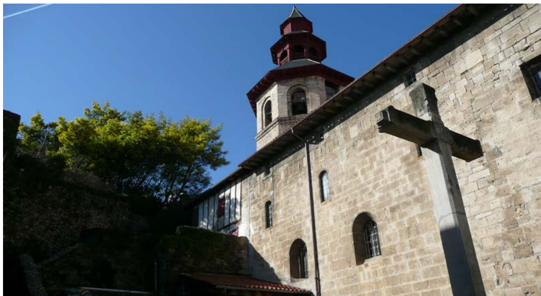
Eglise de Ciboure