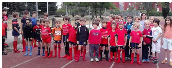
Les jeunes rugbymen