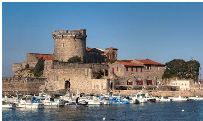
ciboure 64. Port et fort de socoa

Digression sur le couvent des Récollets édifié en 1613 afin de créer un barrage aux affrontements les riverains opposés de la Nivelle sur fond d'histoire de sorcellerie